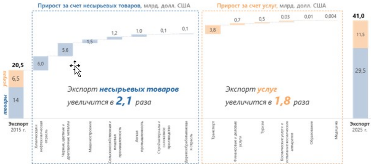
Рисунок 4 - Потенциал прироста несырьевого экспорта Казахстана до 2025 года в разрезе товарных отраслей и сегментов услуг

(Потенциал прироста экспорта услуг и 25%-ный прирост экспорта товаров (3,75 млрд. долл. США) может быть реализован за счет перспективной экспортной корзины, в случае оказания необходимых мер поддержки)