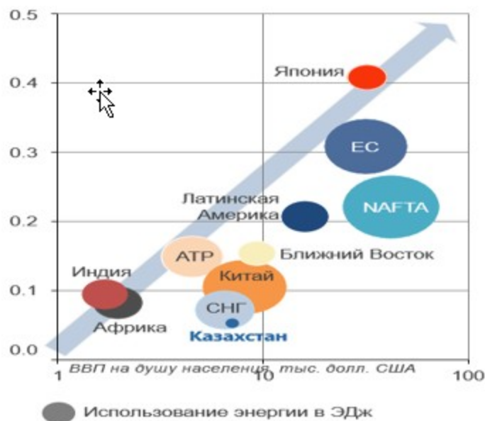
Рисунок 3 - Коэффициент энергоемкости экономики

3) низкая производительность труда. В Казахстане в среднем на один человеко-час в 2016 году произведено ВВП по ППС на сумму 28 долл. США, что в 2-2,5 раза меньше, чем в развитых странах 10 .