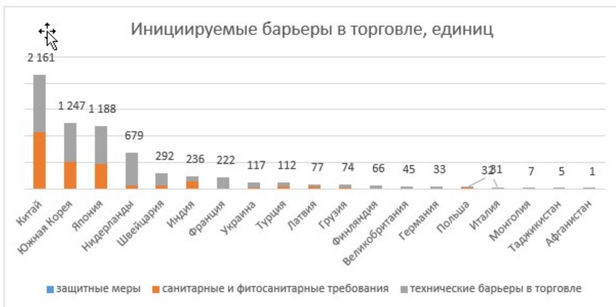
Рисунок 2 – Иницилируемые барьеры в торговле (по состоянию на 30 апреля 2017 г.)

Помимо этого, существуют фундаментальные факторы и ограничения, определяемые уровнем экономического и инновационно-технологического развития