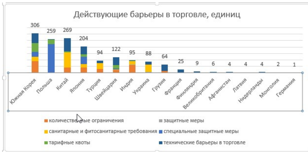
Рисунок 1 – Действующие барьеры в торговле (по состоянию на 30 апреля 2017 г.)